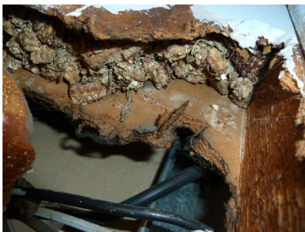
Obr. Použití kukuřice jako tepelné izolace