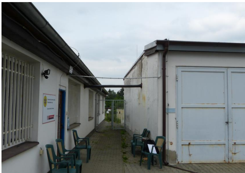
Obr.: propojení teplovodu do budovy SO3 (garáže)