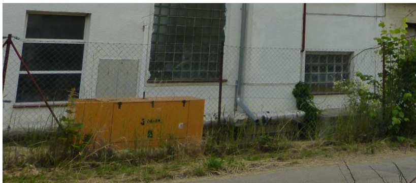
Obr.: vedení teplovodu od výměňkové stanice