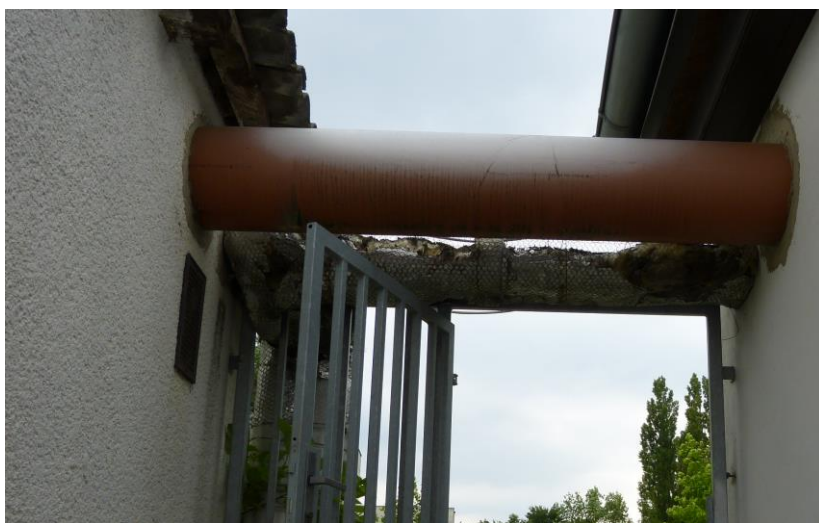
Obr.: napojení teplovodu do budovy SO5 (Stanoviště ZZS)